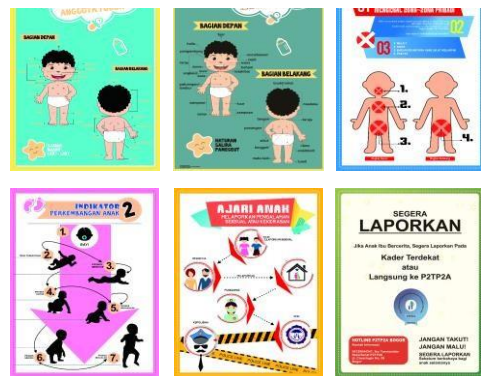
Gambar 4.2. Model akhir