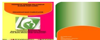
Gambar.4.6 Model Akhir Modul