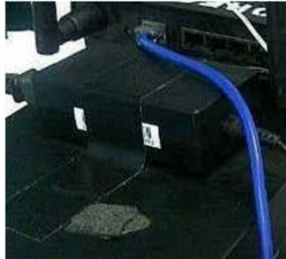
Gambar 3. Kabel straight

Susunan Kabel Lurus (Straight Cable) di PT PLN (Persero) Leuwiliang, menghubungkan pasangan nomor pin yang sama, atau menghubungkan warna kabel yang sama. Kabel lurus ini digunakan pada saat menghubungkan antara komputer- komputer (yakni kartu jaringan) dengan switch atau dari Access point ke komputer.