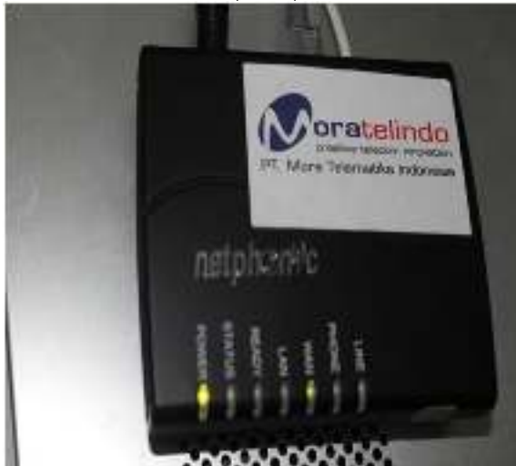
Gambar 5. Dekstop PC

Merupakan perangkat akses untuk user, mobile PC pada umumnya sudah terpasang port PCMCIA sedangkan desktop PC harus ditambahkan wireless adapter melalui Peripheral Component Interconnect (PCI) card atau Universal Serial Bus (USB).