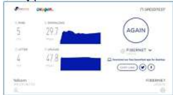
Gambar 9. Pengujian jaringan sore