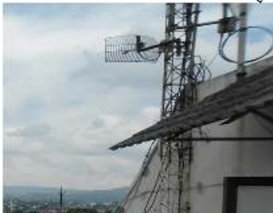
Gambar 2. Antena Eksternal

Antena external ini digunakan untuk memperkuat daya pancar. Antena external ini sebenarnya dapat dirakit sendiri oleh user. contoh : antena kaleng, wajan bolik, dll. Antena ini dipasang dilantai atas tepatnya diatas ruangan laboratorium di PT PLN Leuwiliang hal ini dimaksudkan agar jangkauan sinyal dapat lebih