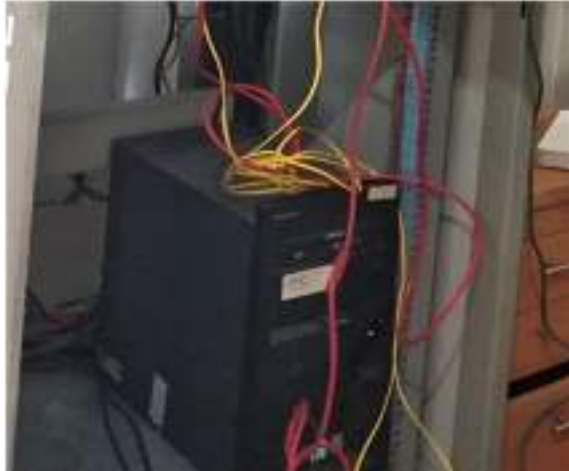
Gambar 1. Server

Server yaitu sebetuk system computer yang mempersiapkan jenis layanan tertentu dalam sebetuk jaringan computer. Server di PT PLN (Persero) ULP Leuwiliang letak pada dilantai satu tepatnya di ruangan server pada PT PLN (Persero) ULP Leuwiliang, di ruangan server ini terletak beberapa server yang terdiri dari server email, WEB dll.