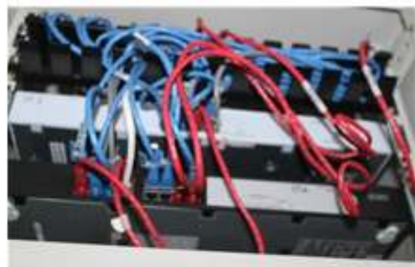
Gambar 4. Kabel cross

Susunan Kabel silang (Crossover) atau yang dimaksud dengan kabel silang dimana posisi nomor pin tertentu pada konektor RJ-45 ditukar posisinya ke nomor pin yang lainnya. Kabel silang ini digunakan pada saat menghubungkan antara switch dengan switch yang lainnya. Di PT PLN (Persero) Leuwiliang penggunaan kabel Cross ini dapat dijumpai dibagian ruangan server