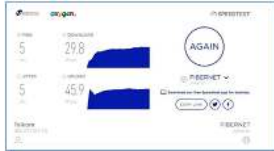
Gambar 8. Pengujian jaringan siang c) Pengujian Wirelles PT PLN di sore hari